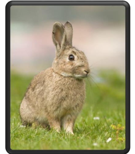
LAPIN DE GARENNE

LE GRÈBE HUPPÉ EST UNE ESPÈCE D'OISEAU AQUATIQUE DE LA FAMILLE DES PODICIPÉDÉS. C'EST LE PLUS GRAND DES GRÈBES PRÉSENTS EN EUROPE. SON BEC EST UN VÉRITABLE HARPON ET C'EST ÉGALEMENT UN SUPERBE PLONGEUR. IL EMMÈNE MÊME PARFOIS CES PETITS SUR SON DOS LORSQU'IL PLONGE POUR CAPTURER DES POISSONS. EN FIN D'HIVER IL SE LANCE DANS DES DANSES ACROBATIQUES POUR SÉDUIRE LA FEMELLE TOUT EN LUI OFFRANT DE PETITS POISSONS. A TES JUMELLES !