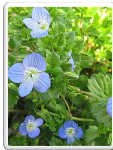
VERONIQUE DE PERSE

ELLE PIQUE CEUX QUI S'EN APPROCHENT MAIS C'EST UNE PLANTE COMESTIBLE (SES FEUILLES SE MANGENT SI QUELQU'UN DE TA FAMILLE SAIT LA CUISINER EN SOUPE, EN CAKE OU EN PESTO) ET C'EST L'UNE DES PLANTES INDISPENSABLE POUR PERMETTRE À DE NOMBREUX PAPILLONS DE SE REPRODUIRE.