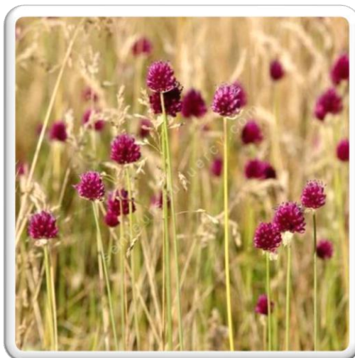
AIL À TÊTE RONDE

ON COMPTE SUR TOI POUR TROUVER UNE DE CES 3 PLANTES !