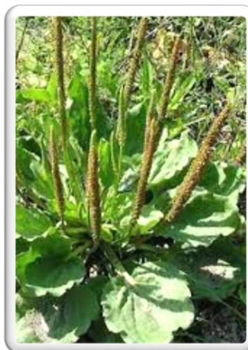
PLANTAIN DES SABLES

L'AIL À TÊTE RONDE, EST UN AIL D'ORNEMENT TRÈS RÉPANDU DANS LE SUD DE L'EUROPE, OÙ L'ON REPÈRE EN DÉBUT D'ÉTÉ SES JOLIES FLEURS EN POMPONS GRENATS ÉMERGEANT DE PAYSAGES SOUVENT ROCAILLEUX ET UN PEU ARIDES.