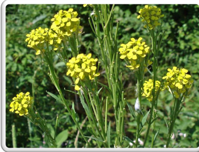
VÉLAR FAUSSE GIROFLÉE

LA RENONCULE RAMPANTE, PLUS CONNUE SOUS LE NOM DE BOUTON D'OR, EST UNE PLANTE JUGÉE ENVAHISSANTE..