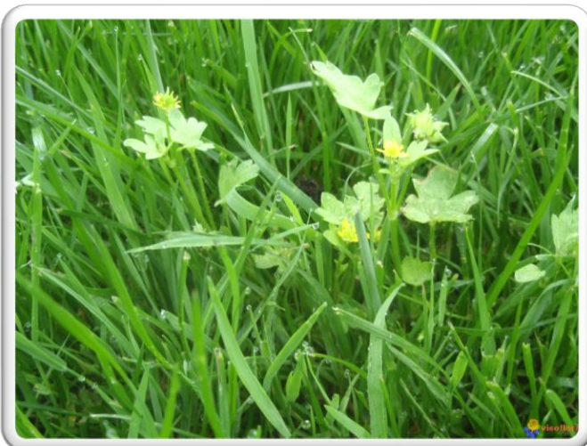
RENONCLE A PETITES FLEURS

ON COMPTE SUR TOI POUR TROUVER UNE DE CES 3 PLANTES !